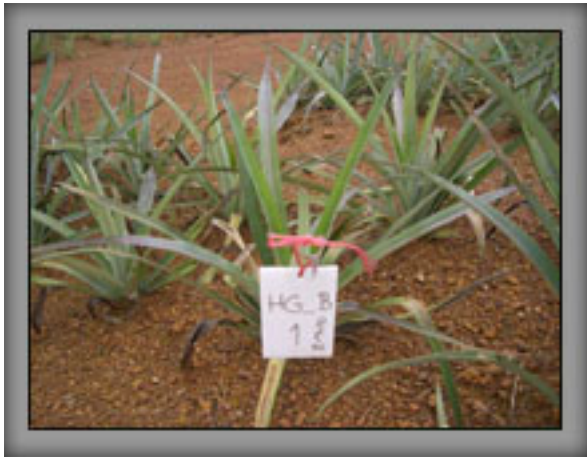
2-ก.ค.-53 แปลงทดสอบ