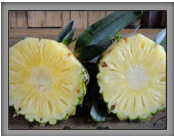
ซ้าย-ผลจากแปลงใช้ เฮอรับากรีน