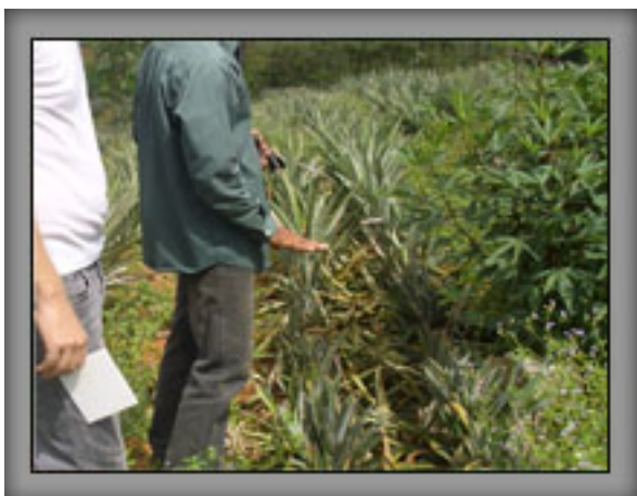
ไม่มียอดใหม่หลังการเก็บเกี่ยว ในแปลงเปรียบเทียบ