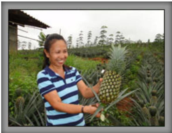
ขนาดผลสับปะรดที่ใช้ เฮอรับากรีน