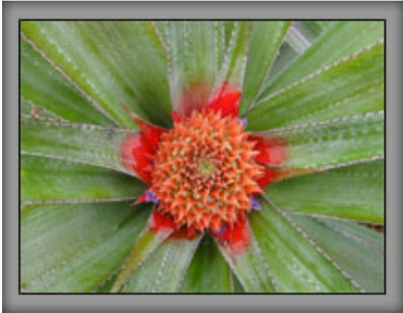
ดอกเข็มโต