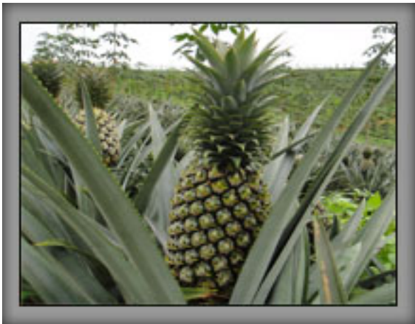
ผลเริ่มโต