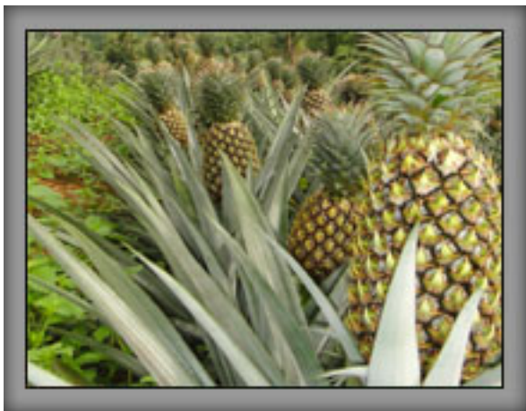
ผลสับปะรดในแปลงที่ใช้ เฮอร์บากรีน