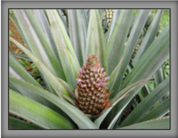
ติดผลอ่อน