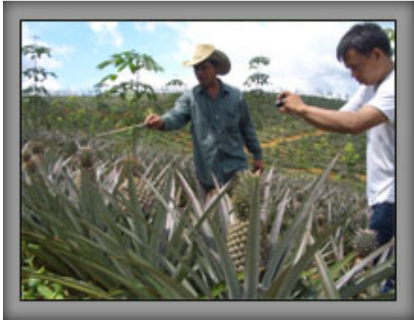
เก็บบันทึกข้อมูลคุณภาพ