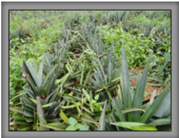
สภาพแปลงเปรียบเทียบ หลังเก็บเกี่ยวผล