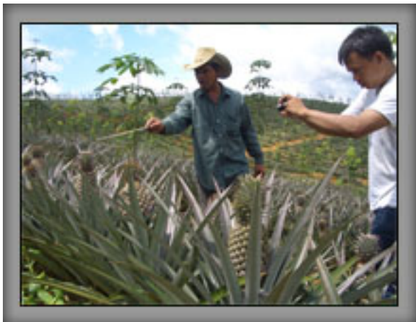
เก็บบันทึกข้อมูลคุณภาพ