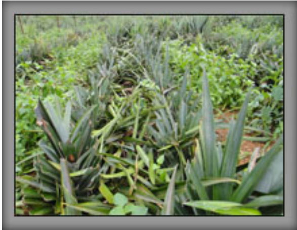
สภาพแปลงเปรียบเทียบ หลังเก็บเกี่ยวผล